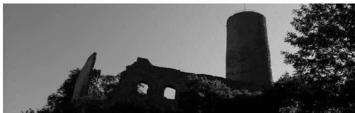
Strahlenburgtrail 11. Oktober 2015